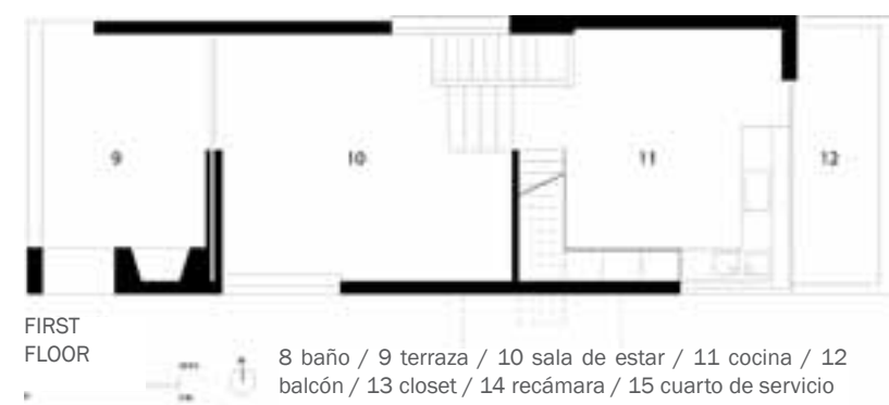
FIRST FLOOR 8 baño / 9 terraza / 10 sala de estar / 11 cocina / 12 balcón / 13 closet / 14 recámara / 15 cuarto de servicio