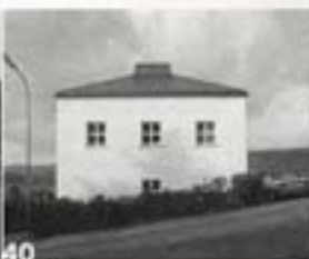
Moselle: Classic values