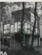
Gascony: Beautiful blend