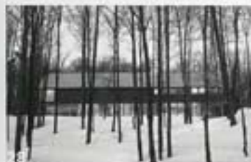
Canada: A far from normal holiday home