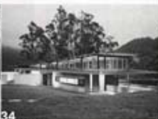
Australia: An elegant shed