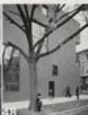
Chicago: Urban openness